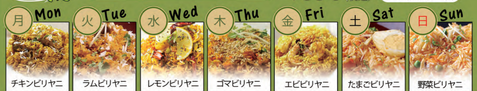
月 Mon チキンビリヤニ | 火 Tue ラムビリヤニ | 水 Wed レモンビリヤニ | 木 Thu ゴマビリヤニ | 金 Fri エビビリヤニ | 土 Sat たまごビリヤニ | 日 Sun 野菜ビリヤニ