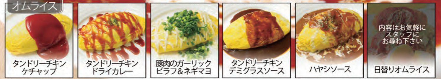
タンドリーチキン ケチャップ | タンドリーチキン ドライカレー | 豚肉のガーリック ピラフ&ネギマヨ | タンドリーチキン デミグラスソース | ハヤシソース | 内容はお気軽にスタッフにお尋ね下さい 日替りオムライス