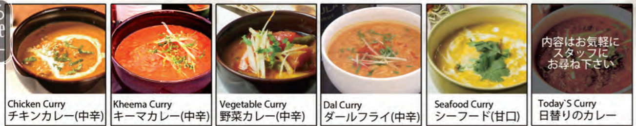
Chicken Curry チキンカレー(中辛) | Kheema Curry キーマカレー(中辛) | Vegetable Curry 野菜カレー(中辛) | Dal Curry ダールフライ(中辛) | Seafood Curry シーフード(甘口) | Today's Curry 日替りのカレー